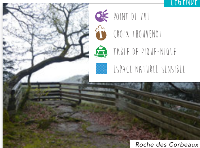
Roche des Corbeaux