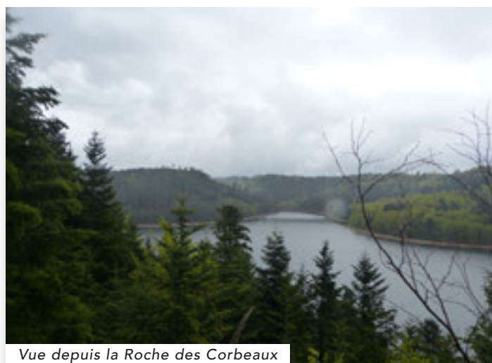
Vue depuis la Roche des Corbeaux