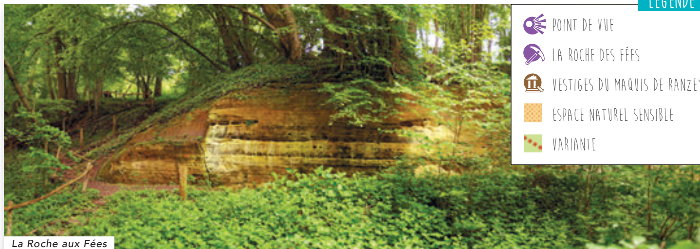
La Roche aux Fées