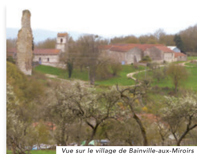
Vue sur le village de Bainville-aux-Miroirs