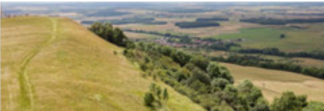
vue sur les secteurs sensibles de la pelouse calcaire