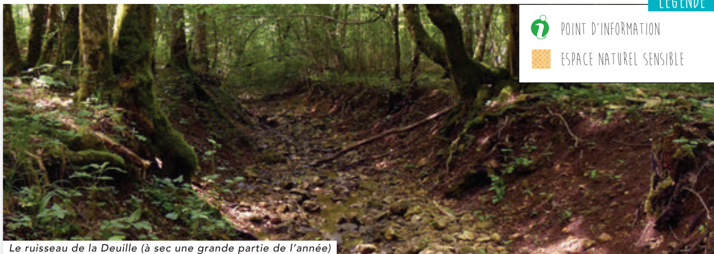
Le ruisseau de la Deuille (à sec une grande partie de l'année)

Dirigez-vous enfin jusqu'au point de départ : porte de Blénod-les-Toul puis RD114.