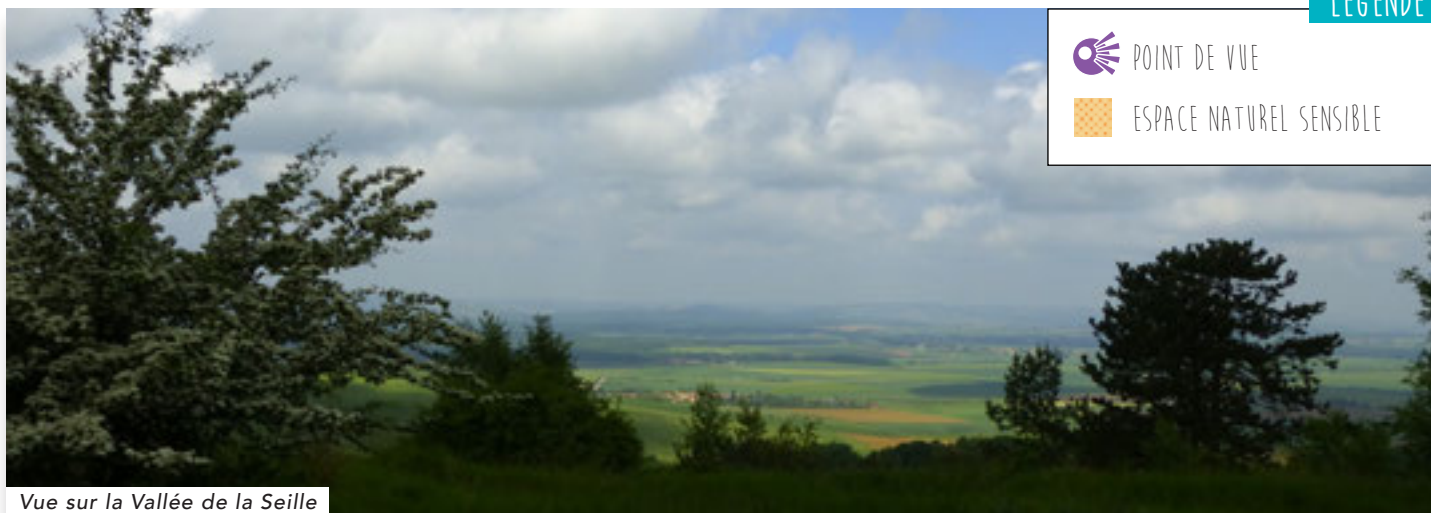
Vue sur la Vallée de la Seille

Enfin, continuez tout droit puis tournez à gauche Grande Rue afin de regagner le parking et le point de départ.