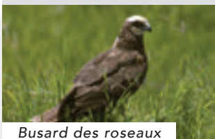
Busard des roseaux

Les trois espèces de busards « français » sont présentes ici : busard cendré, busard des roseaux et busard Saint-Martin. Ces rapaces, élégants et majestueux, d'une taille intermédiaire entre buse et faucon se nourrissent de petits rongeurs et sont à ce titre les alliés des agriculteurs. En raison de la régression des grandes zones de landes, leur habitat d'origine, ils nichent aujourd'hui dans les cultures céréalières. Pour que les jeunes oiseaux ne soient pas des victimes involontaires des engins agricoles, des territoires sont protégés et les agriculteurs sont indemnisés pour cela.