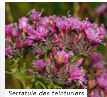
Serratule des teinturiers