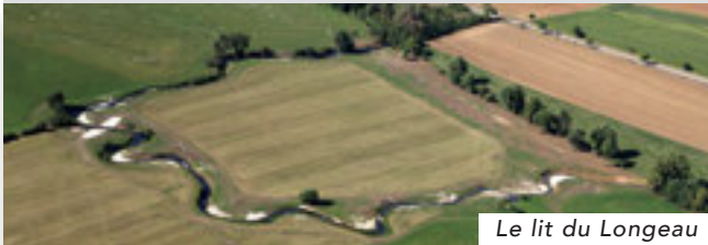
Le lit du Longeau

Dans les années 60, on a rectifié le lit du Longeau pour satisfaire aux besoins de l'agriculture mécanisée. Ces travaux avaient permis la mise en culture de terres céréalières mais avaient aussi généré des risques d'inondation dans les zones urbaines situées en aval. Entre 2010 et 2013, de nouveaux travaux ont permis au Longeau de retrouver son lit, jouant ainsi à nouveau un rôle bénéfique d'épurateur de l'eau et de régulateur de crues.