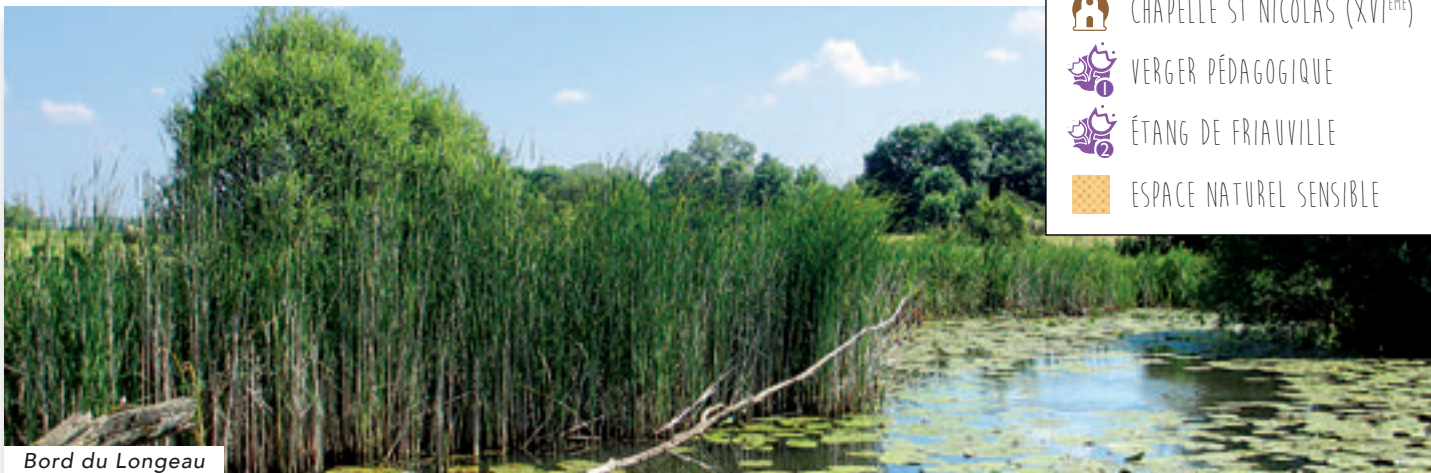
Bord du Longeau