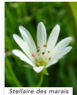
Stellaire des marais