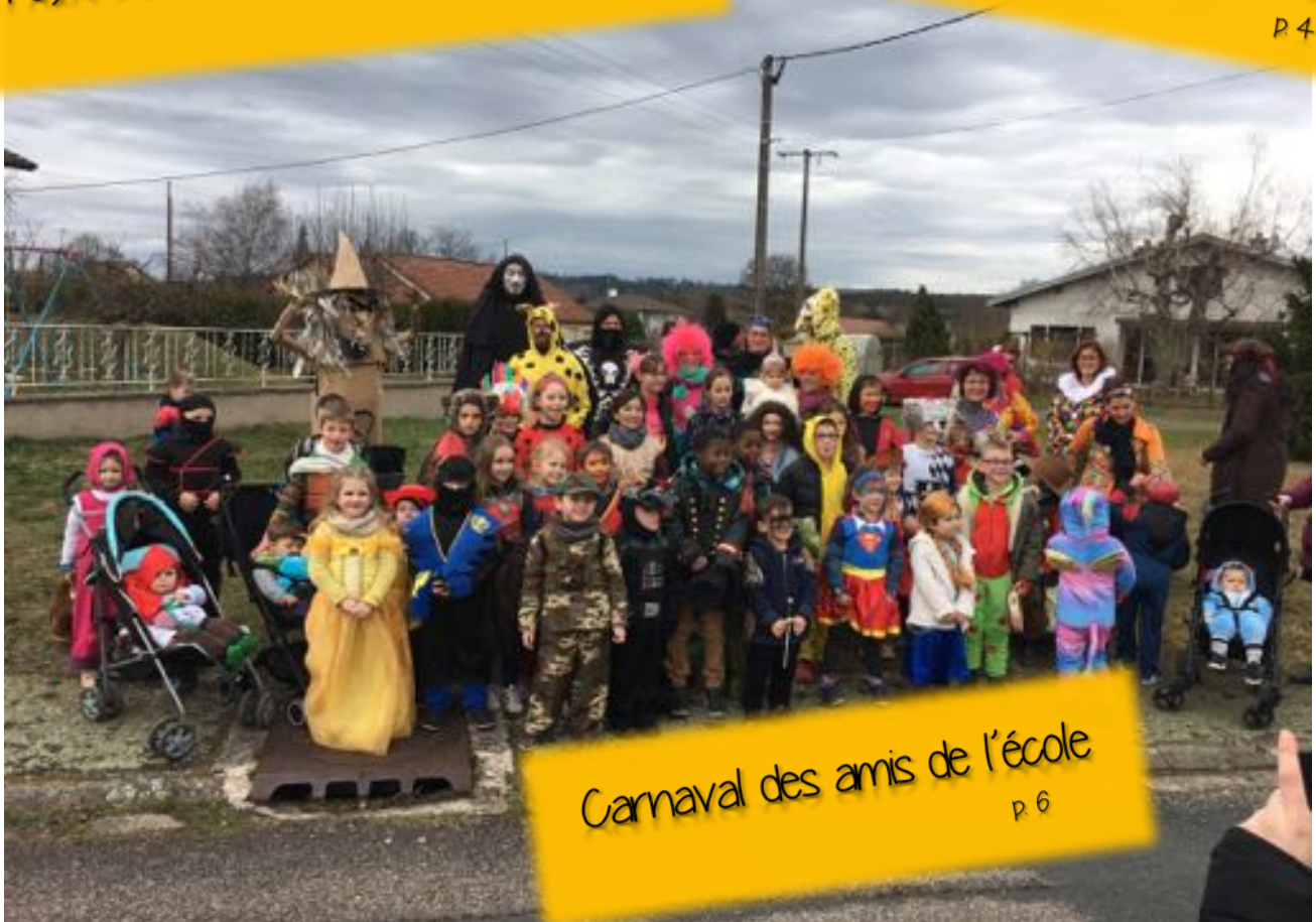
Carnaval des amis de l'école p.6