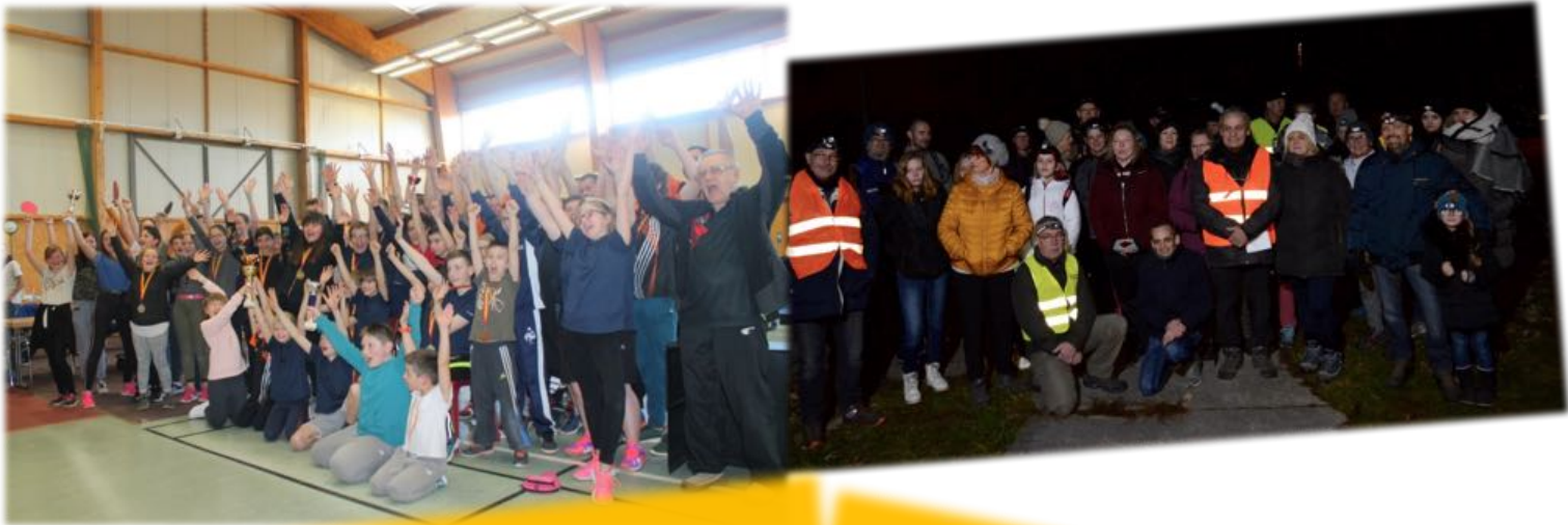
Tournoi de tennis de table des Foyers ruraux de Meurthe et Moselle p.5

Bulletin communal d'informations de THIAVILLE SUR MEURTHE