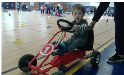
Karting à pédales

Le Vendredi 4 novembre, dans la salle de sports de Baccarat, nous avons découvert plein d'objets roulants. C'était super! Nous avons joué toute la matinée.