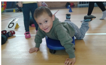
Planche à roulettes