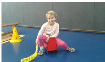
Hockey sur roues