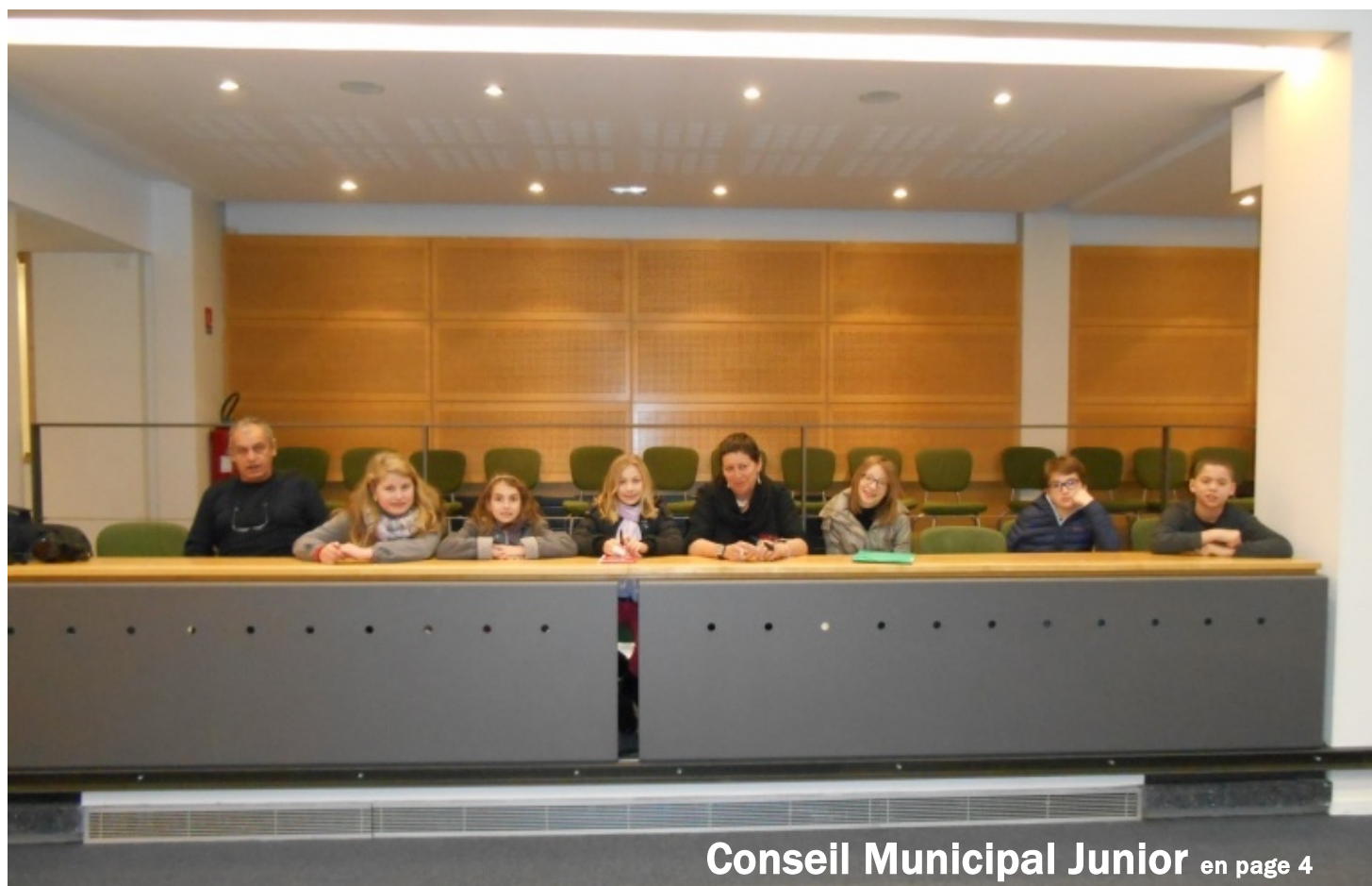
Conseil Municipal Junior en page 4

Bulletin communal d'informations de THIAVILLE SUR MEURTHE