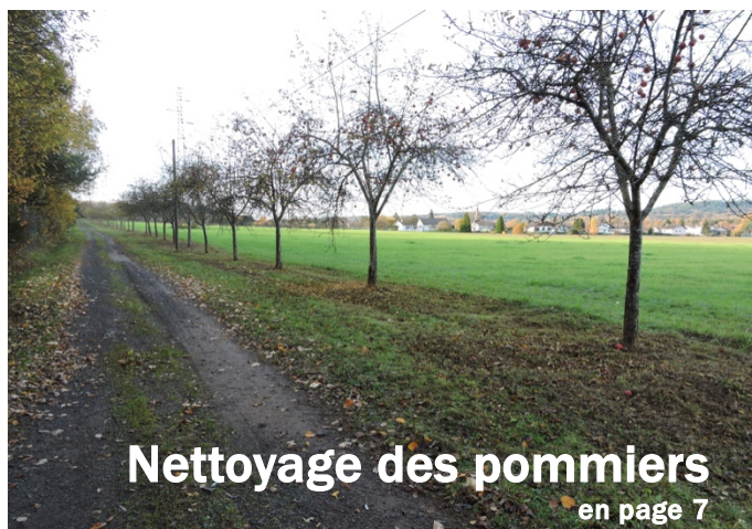
Nettoyage des pommiers en page 7