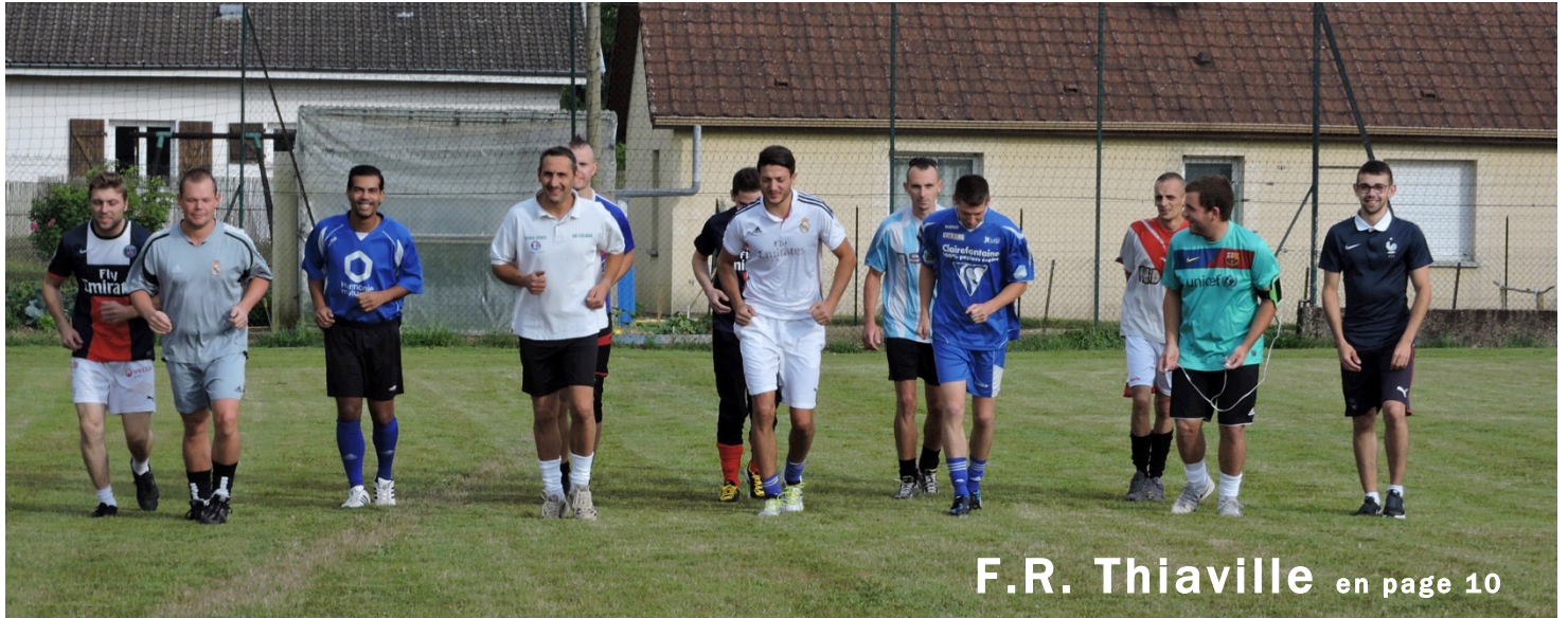
F.R. Thiaville en page 10

Bulletin communal d'informations de THIAVILLE SUR MEURTHE