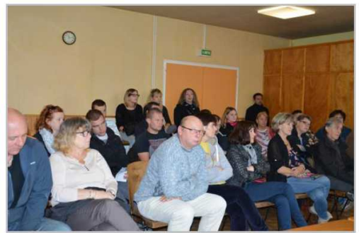
La salle Bietry était trop petite pour accueillir les participants.