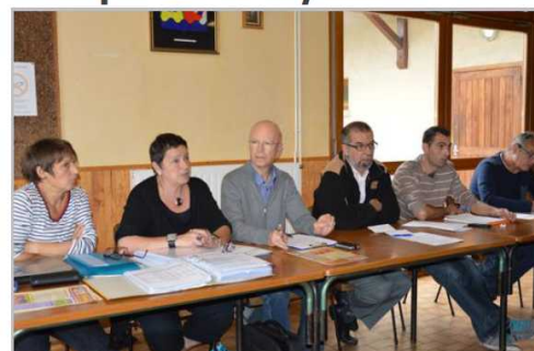
Elus et bénévoles main dans la main pour une réussite collective.