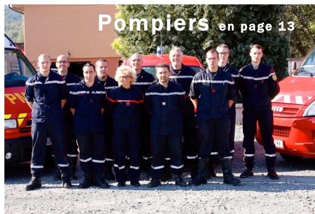
Pompiers en page 13