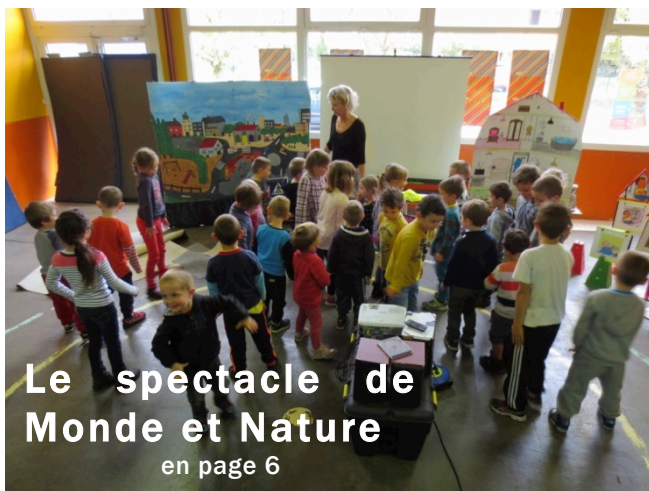
Le spectacle de Monde et Nature en page 6